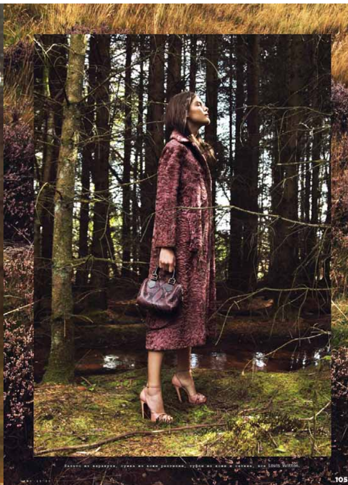
Свитер из кашемира, юбка из кашемира, топ из кашемира и кашемира, сумка Louis Vuitton.