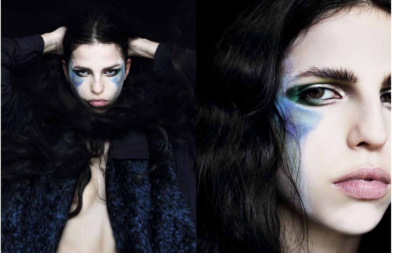
Hayett for 1Granary