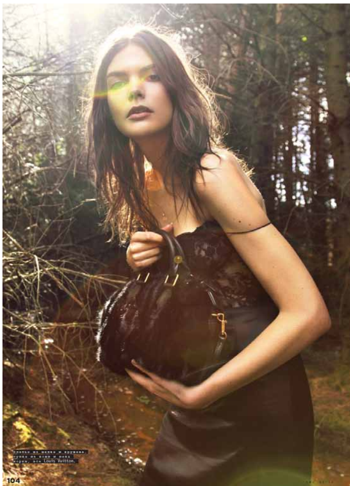
Свитер из кашемира, топ из шелка и кашемира, юбка из кашемира и кашемира, сумка из Louis Vuitton.